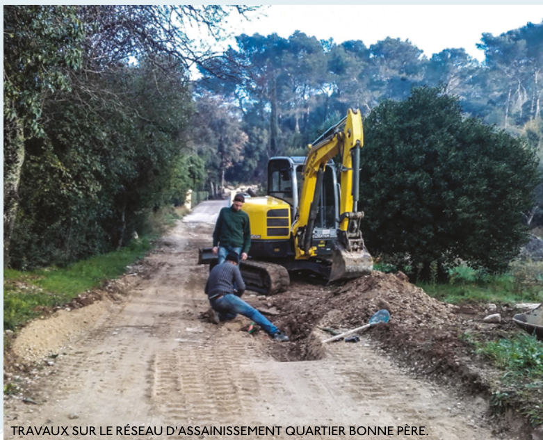
TRAVAUX SUR LE RÉSEAU D'ASSAINISSEMENT QUARTIER BONNE PÈRE.

Q uartier de la Brèche, l'extension du réseau d'eau potable réalisée sur une centaine de mètres a permis l'installation d'une défense incendie pour les habitations environnantes. Ces travaux ont également permis l'amélioration du réseau existant, par la reprise des branchements particuliers.