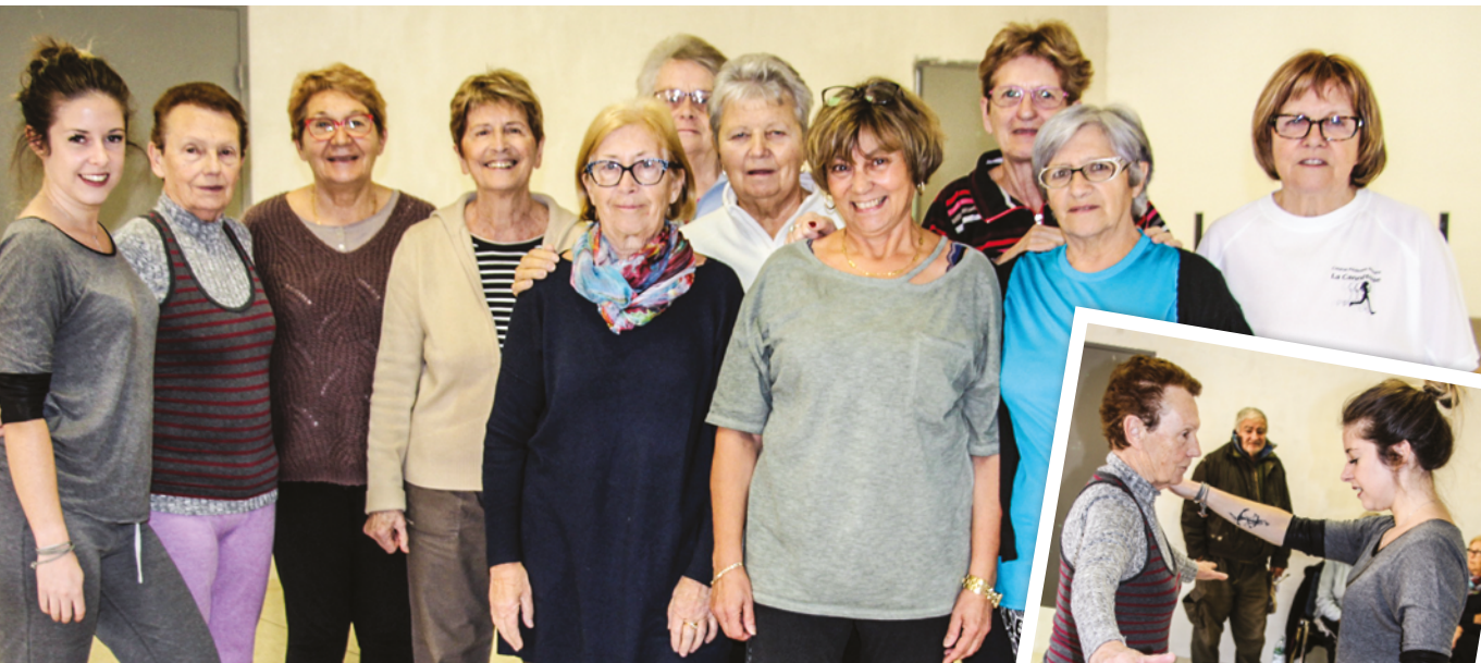
ATELIER GYMNASTIQUE DOUCE DU 09 JANVIER 2020 ENCADRÉ PAR L'ASSOCIATION SIEL BLEU.

Dans le cadre du programme "bien vieillir au Cannet", un nouveau cycle d'ateliers de gym-équilibre est proposé jusqu'en mars 2020.