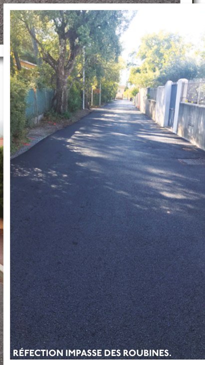
RÉFECTION IMPASSE DES ROUBINES.