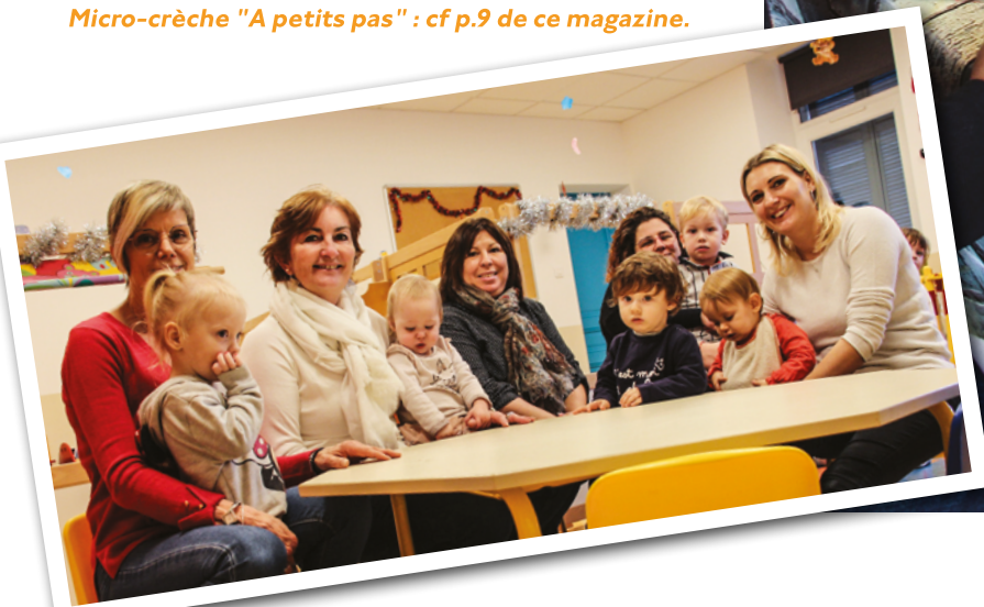
ÉQUIPE DE LA CRÈCHE "LES CANNETONS" SITUÉE RUE JEAN GIONO.