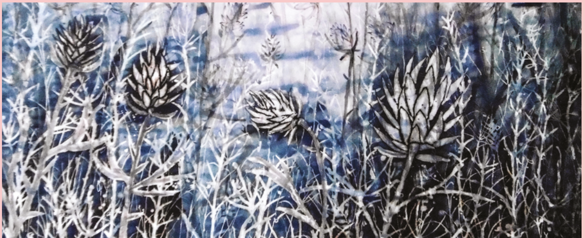
OEUVRE DE L'ARTISTE TIJANA NIKITOVIC À RETROUVER DÈS LE 10 AVRIL À LA MÉDIATHÈQUE MUNICIPALE.

Du 10 avril au 03 juin, l'artiste Tijana Nikitovic habillera la salle d'exposition de la médiathèque municipale avec son oeuvre "Un voyage, un passage, le temps, un instant...".