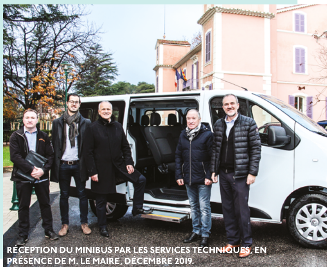
RÉCEPTION DU MINIBUS PAR LES SERVICES TECHNIQUES, EN PRÉSENCE DE M. LE MAIRE, DÉCEMBRE 2019.

Pour s'inscrire ou réserver une place, s'adresser à la Maison de la Fraternité au 04 94 50 08 21.