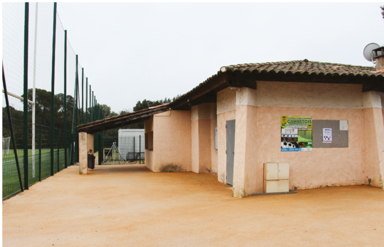
CI-DESSOUS ET CI-CONTRE : RESTAURATION INTÉRIEURE ET EXTÉRIEURE DE LA BUVETTE, ET RÉFECTION DES SANITAIRES.

Les vestiaires du stade ont été rafraîchis et réorganisés, et de nouveaux sanitaires sont venus compléter les aménagements existants.