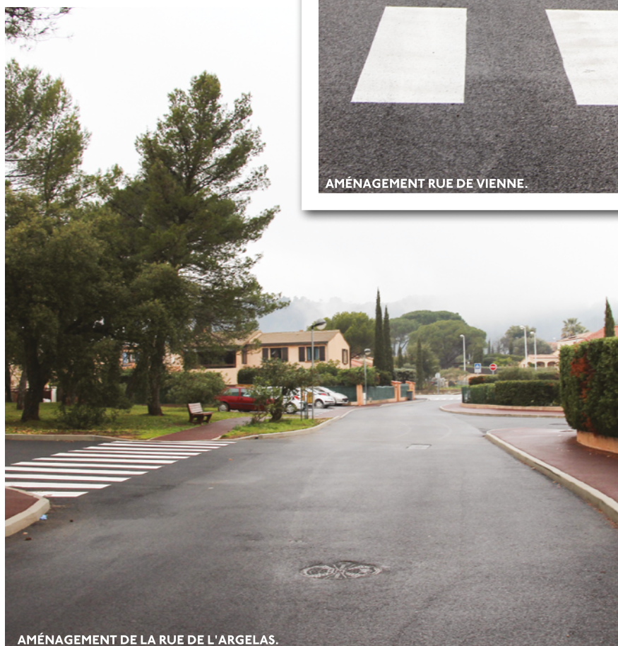
AMÉNAGEMENT DE LA RUE DE L'ARGELAS.