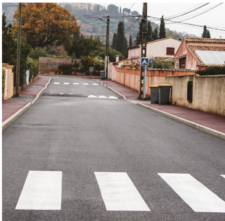
AMÉNAGEMENT RUE DE VIENNE.

Enfin, six ralentisseurs ont été rabaissés rue de L'Argelas, voie Aurélienne, traverse Taurelle et sur l'aire du Recoux.