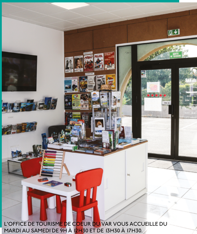
L'OFFICE DE TOURISME DE COEUR DU VAR VOUS ACCUEILLE DU MARDI AU SAMEDI DE 9H À 12H30 ET DE 13H30 À 17H30.

Pour tout renseignement touristique concernant Le Cannet des Maures ou les onze communes de Cœur du Var, l'équipe de l'office de tourisme intercommunal est à votre écoute au 04 89 26 03 80.