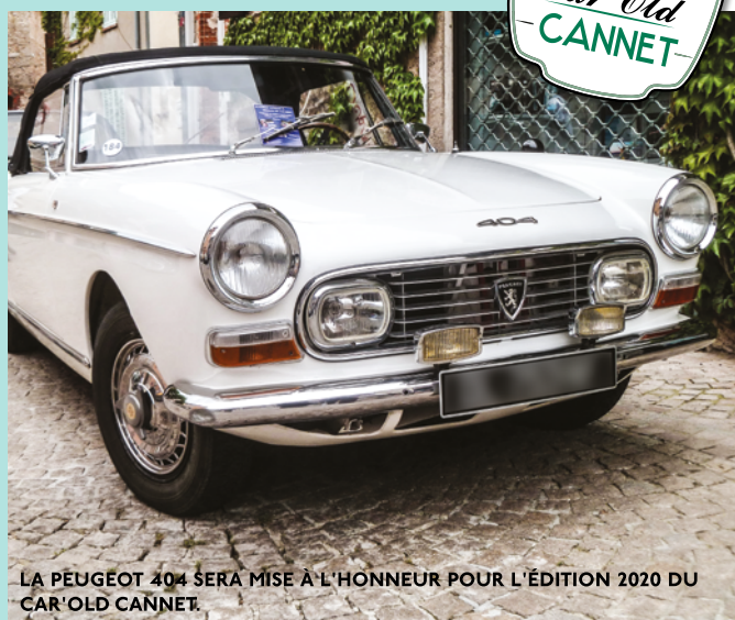
LA PEUGEOT 404 SERA MISE À L'HONNEUR POUR L'ÉDITION 2020 DU CAR'OLD CANNET.

Renseignements complémentaires auprès de la mairie au 04 94 50 10 09.