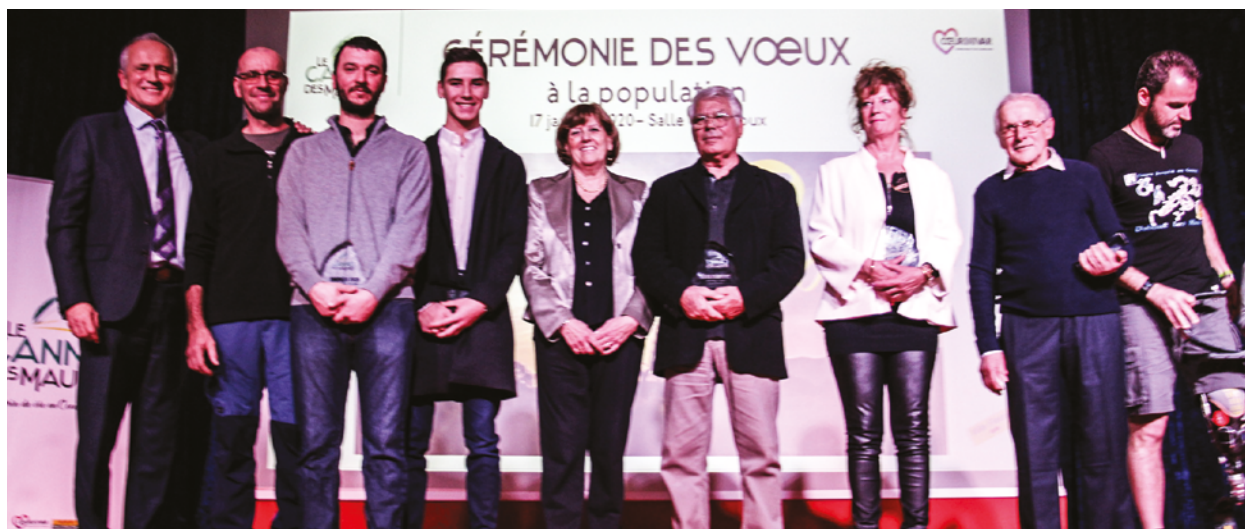
ENSEMBLE DES PERSONNES MISES À L'HONNEUR POUR LA CÉRÉMONIE DES VOEUX À LA POPULATION 2020.

La cérémonie des vœux à la population a accueilli cette année près de 600 personnes.