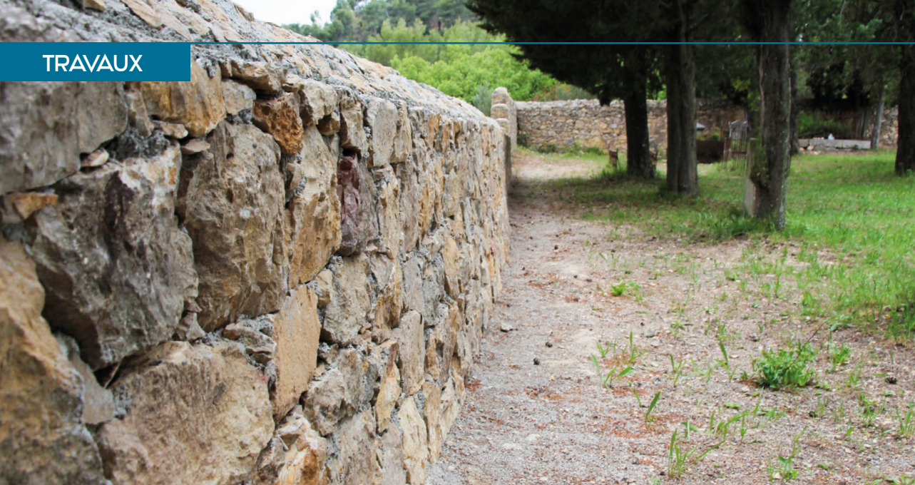
RÉFECTION DU MUR D'ENCEINTE GRÂCE AU CHANTIER D'INSERTION ADESS QUI S'EST DÉROULÉ EN MARS 2021.