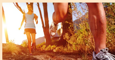
NATATION, VTT ET TRAIL SERONT LES TROIS DISCIPLINES PRINCIPALES DE CE RAID AVENTURE.