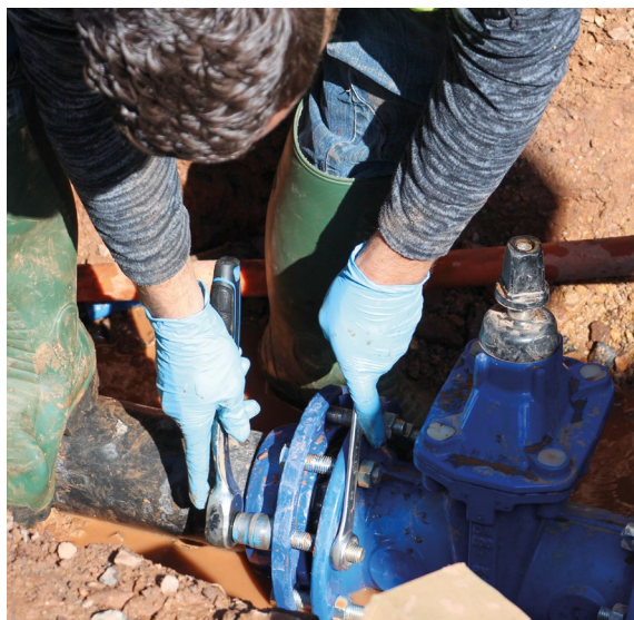
TRAVAUX SUR LES RÉSEAUX D'EAU DE L'AVENUE DE VERDUN, MARS 2019.

En quelques chiffres , cela représente 1 000 mètres d'extension du réseau d'eau potable et 120 mètres de réseau d'assainissement qui ont été renouvelés. Six bornes incendie ont été installées afin de sécuriser les espaces.