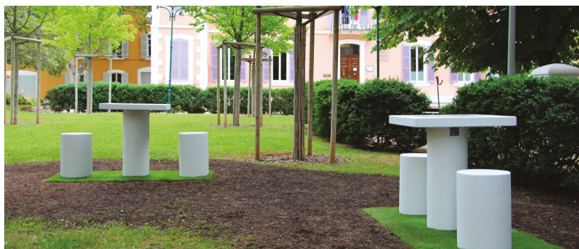
POUR UTILISER LES TABLES D'ÉCHECS ET DE PING-PONG, IL EST NÉCESSAIRE DE SE MUNIR DE SON MATÉRIEL (RAQUETTES, BALLE, ÉCHECS).

Ainsi, en mai dernier, une table de ping-pong a été installée à proximité de la passerelle de l'Avenir sur l'aire du Recoux, et deux tables d'échecs et de dames ont été positionnées dans le parc Pellegrin.