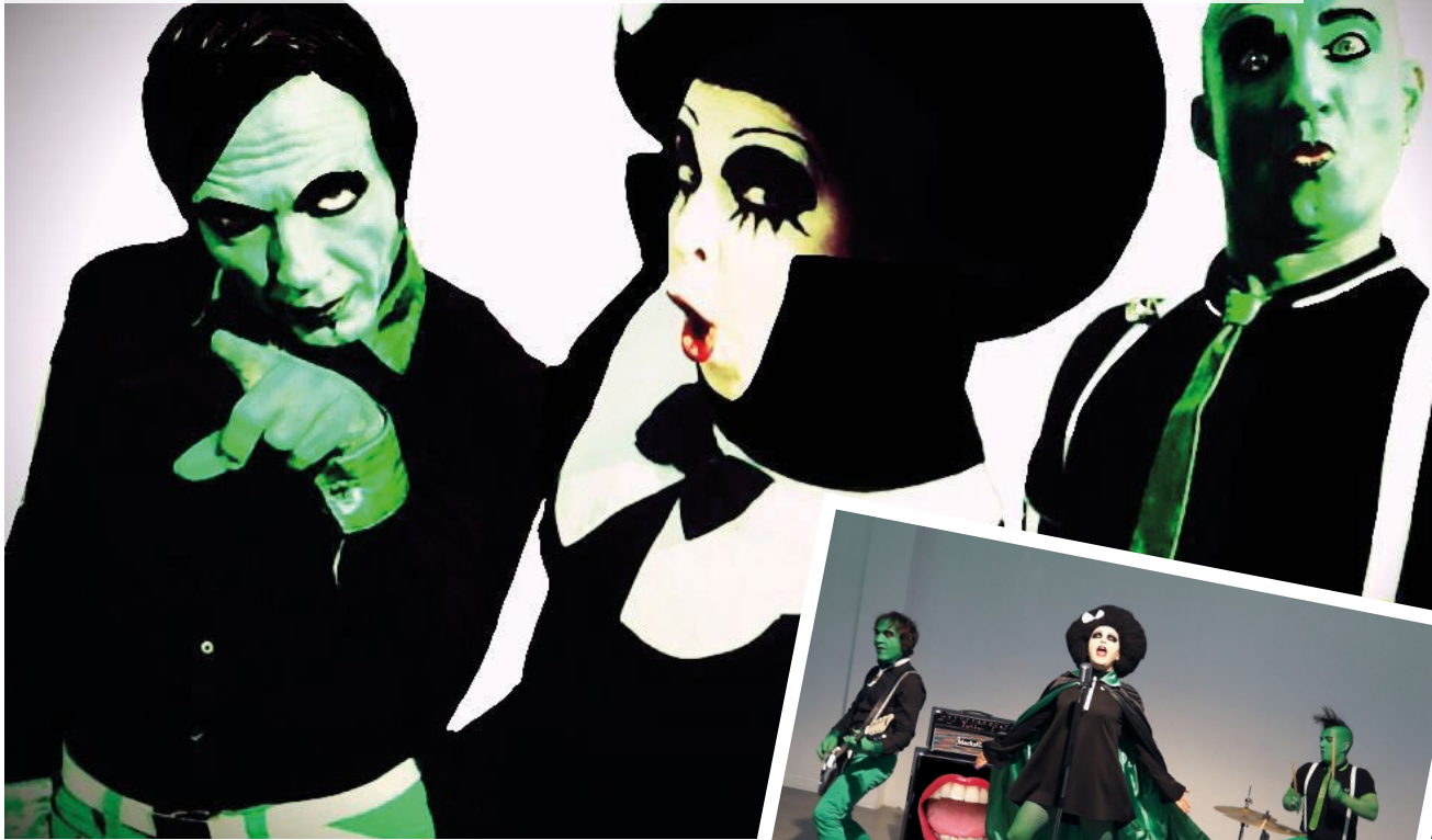
CI-DESSUS, LA POISON SERA SUR SCÈNE DIMANCHE 18 JUILLET. CI-DESSOUS, AFFICHE OFFICIELLE DU FESTIVAL