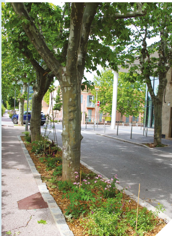
CI-DESSUS ET CI-DESSOUS, INSTALLATION DE JARDINIÈRES PLEINE TERRE AVENUE DE VERDUN, AVEC PAILLAGE (FABRIQUÉ EN INTERNE) POUR MAINTENIR L'HUMIDITÉ ET DIMINUER LA CONSOMMATION D'EAU.

Ces jardinières offrent enfin une surface de fleurissement supplémentaire, participant à l'embellissement global de la ville.