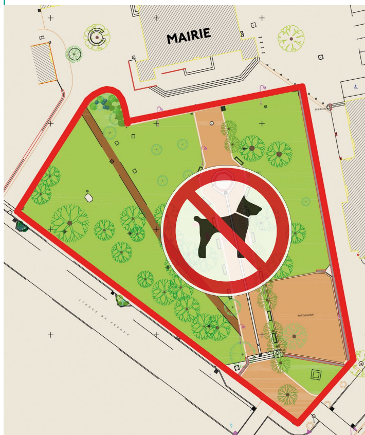
PÉRIMÈTRE D'INTERDICTION DES CHIENS, MÊME TENUS EN LAISSE, DANS LE PARC PELLEGRIN.

Le parc Henri Pellegrin est destiné à la détente et à la promenade. Afin d'en préserver la sécurité et la tranquillité, son accès est interdit aux animaux, même tenus en laisse, exception faite pour les chiens de personnes handicapées .