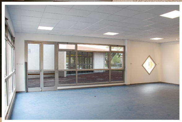
LA CLASSE N°7 DE L'ÉCOLE MATERNELLE LEÏ PICHOUN EST PRÊTE À ACCUEILLIR SES OCCUPANTS.