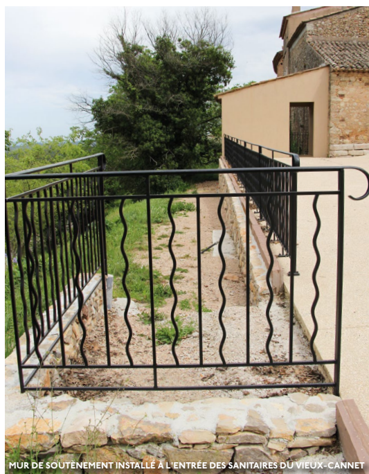
MUR DE SOUTÈNEMENT INSTALLÉ À L'ENTRÉE DES SANITAIRES DU VIEUX-CANNET

Cet appel à projet est mis en place par la Région et vise à subventionner des travaux de réfection de mise en valeur du patrimoine non protégé par les Monuments Historiques. La ville a candidaté afin d'y intégrer les travaux de réhabilitation de la chapelle Saint-Jean et de l'entrée du vieux cimetière. Elle travaille