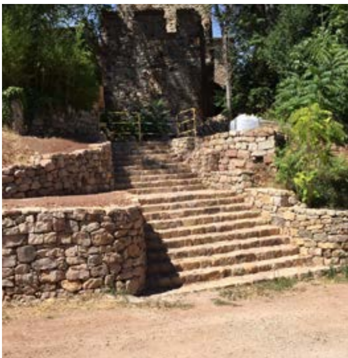
Escalier réhabilité du Vieux Cannet.

Le point sur les grands projets de transformation déjà effectués et ceux prévus pour 2017.