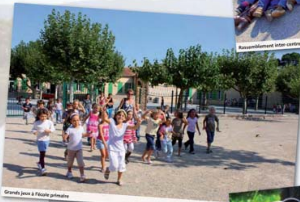
Grands jeux à l'école primaire