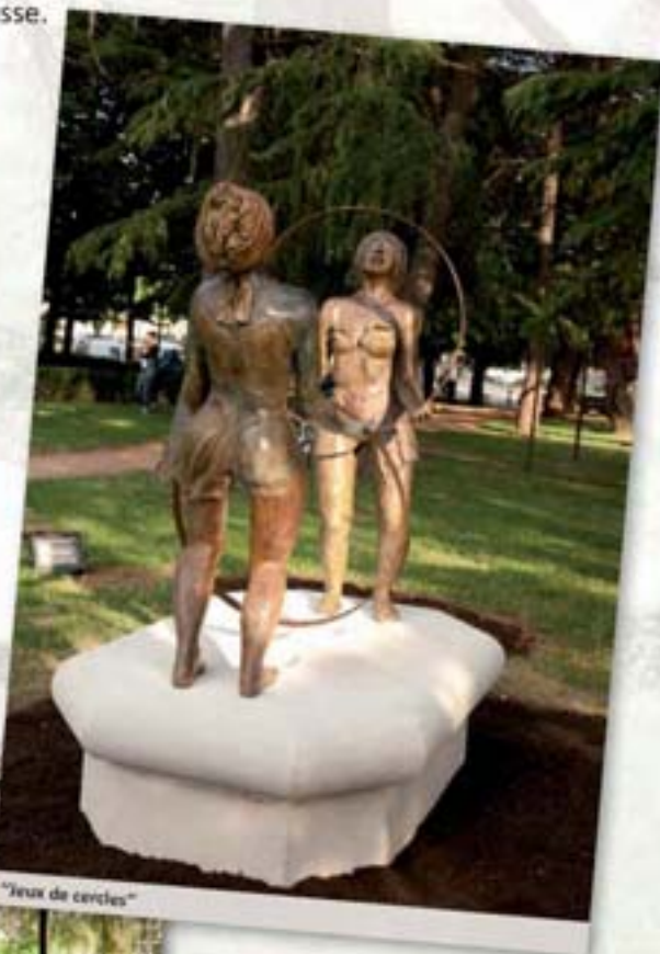
"Jeux de cercles"