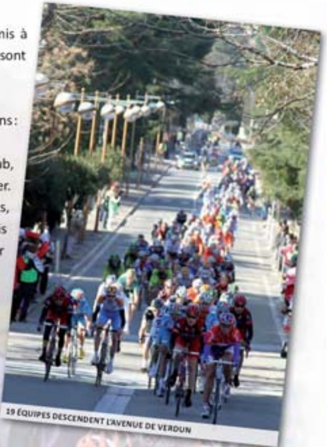
19 ÉQUIPES DESCENDENT L'AVENUE DE VERDUN

Le Judoclub, la chorale, les randonneurs, le club de Rugby, le vélo club, mais aussi des habitants représentés par les référents de quartier. La commune, ses agents et la Maison des Jeunes avec ses adhérents, ont également répondu présents pour cette belle journée qui a permis d'accueillir Monsieur Raymond Poulidor , Parrain du Tour du Haut-Var 2010, qui a eu l'amabilité de se prêter aux dédicaces.