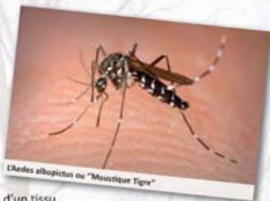
Aedes albopictus ou "Moustique Tigre"

Portez des vêtements couvrants et suffisamment larges en les imprégnant d'insecticide pour tissus.