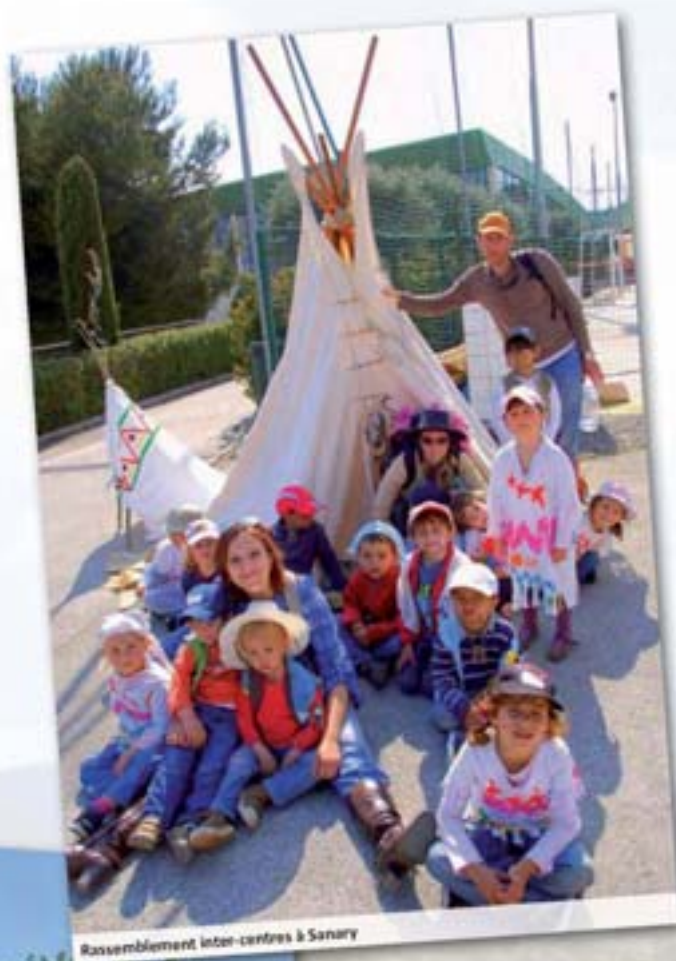
Rassemblement inter-centres à Sanary

Ces activités permettent aux enfants de pouvoir se "défouler" et de se détendre de leur journée d'école.