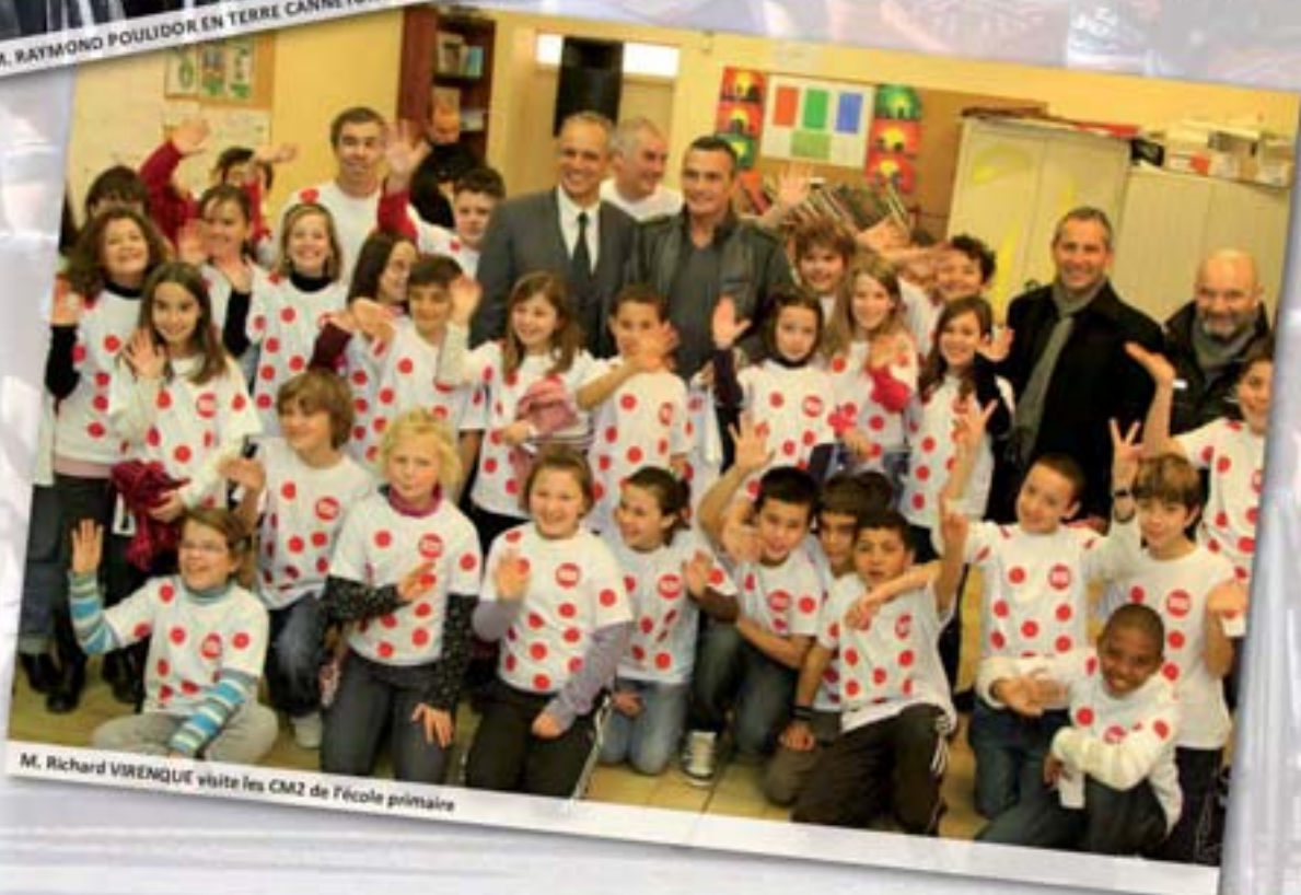
M. Richard VIRENQUE visite les CM2 de l'école primaire