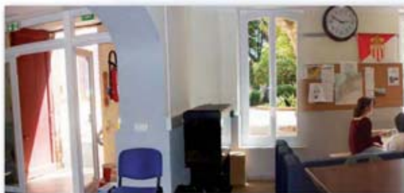
Rénovation de la salle d'accueil de la Maison des Jeunes

C'est avec rigueur et bienveillance que ces agents se consacrent à l'enfance et à la jeunesse auprès des divers points d'accueils de la commune.