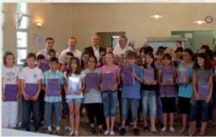
Remise des dictionnaires aux élèves de CM2

L'année prochaine, une cinquantaine d'élèves actuellement en classe de CM2 poursuivront leur scolarité au collège. Pour les féliciter et les encourager à poursuivre leurs efforts, le Maire a offert, le 31 mai, un magnifique dictionnaire, d'une édition spécialement commandée à cette occasion. Ce Petit Larousse Illustré est accompagné d'un CD-Rom permettant de découvrir des ressources multimédia et interactives.