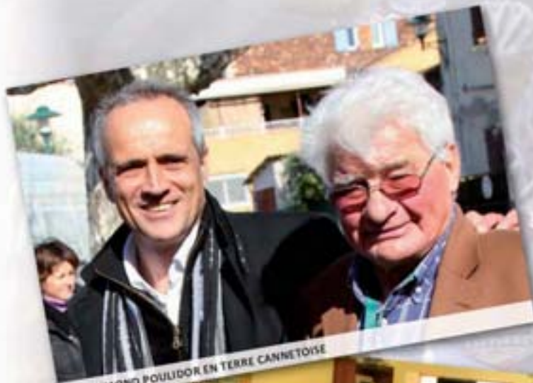
M. RAYMOND POULIDOR EN TERRE CANNETOISE