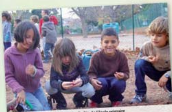
Les premières plantations dans le jardin Bio de l'école primaire