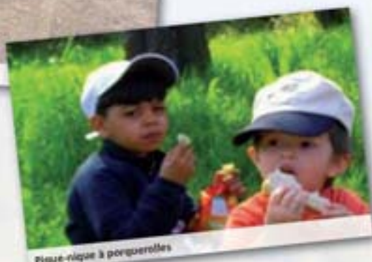
Pique-nique à perquerelles