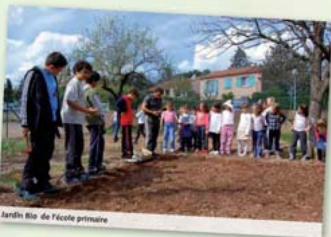
Jardin Bio de l'école primaire

Ils cultivent également un petit jardin potager .