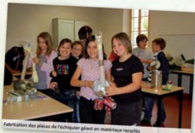
Fabrication des pièces de l'échiquier géant en matériaux recyclés

Alors, notez-le bien dans votre agenda, le vendredi 18 juin 2010, aux écoles maternelle et primaire, venez tous fêter l'attribution du label éco-école à l'école élémentaire du Cannet des Maures, en présence de Mme la Sous-préfète.