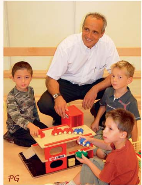
Nos enfants sont notre avenir. Préservons-les...