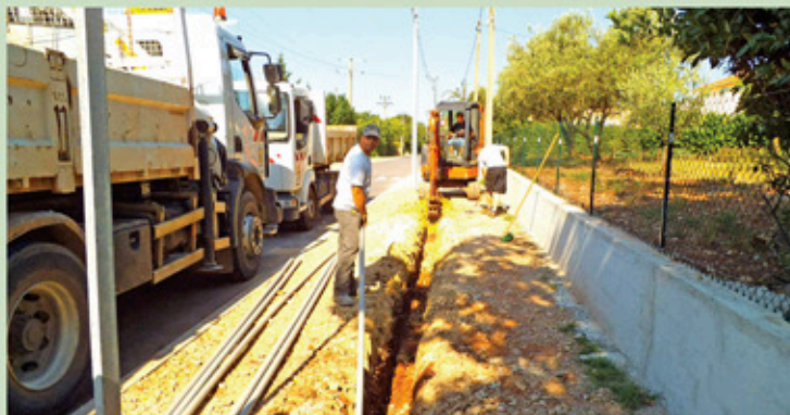
Chemin du Bouillidou - enfouissement du réseau téléphonique