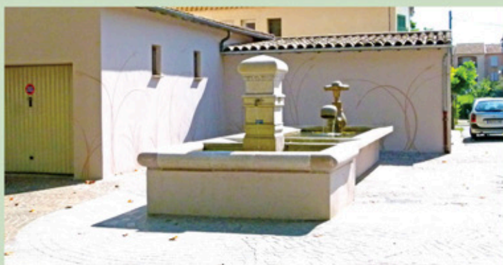
Le robinet dans le lavoir