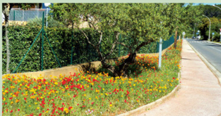
Aménagement espace vert – Avenue de Verdun