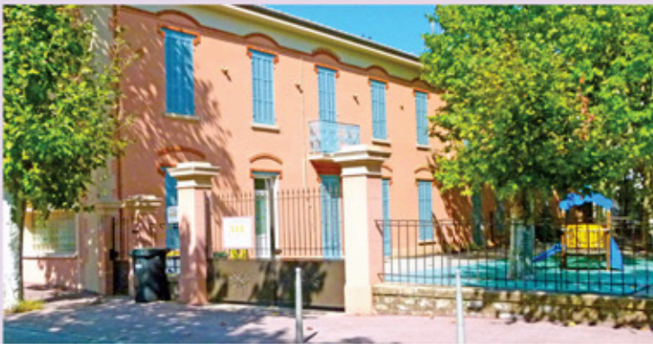
Des locaux rénovés pour Les Cannetons

La crèche associative multi-accueil accueille vos enfants du lundi au vendredi de 8h à 18h.