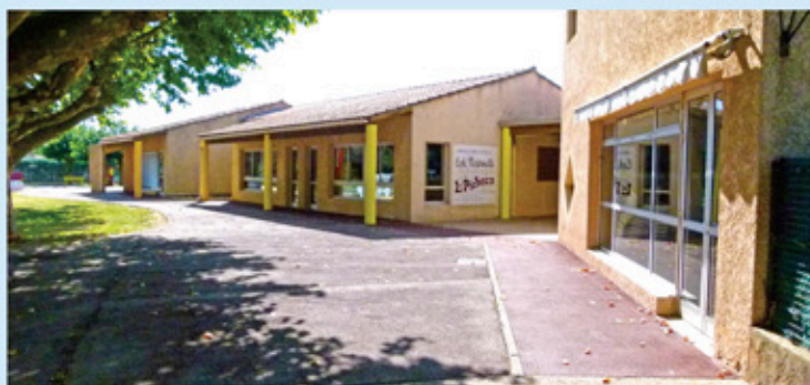
École Maternelle «Leï Pitchoun»

Cette garderie s'effectuera sur le lieu de scolarisation de l'enfant.