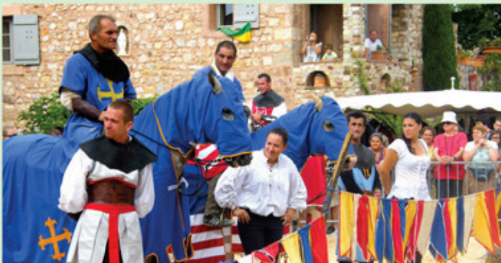
Tournoi de chevalerie