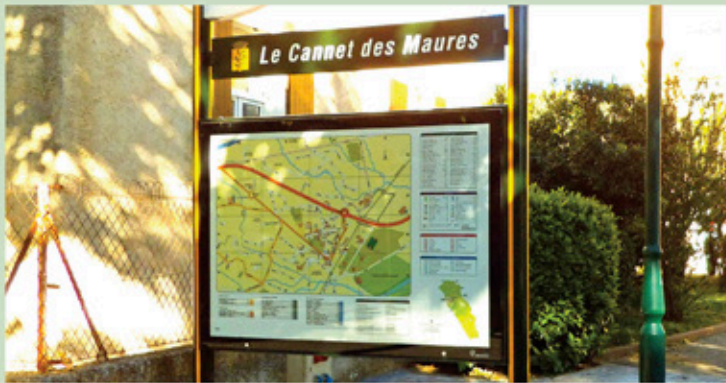
Relais d'information service : centre-ville et commune

La commune, associée à l'association PRCM (Professionnels Réunis du Cagnet des Maures), a procédé à la mise à jour de la signalisation du centre-ville par la pose en régie courant mars de nouveaux panneaux directionnels pour faciliter l'accès vers les lieux publics, les parkings et les commerces.