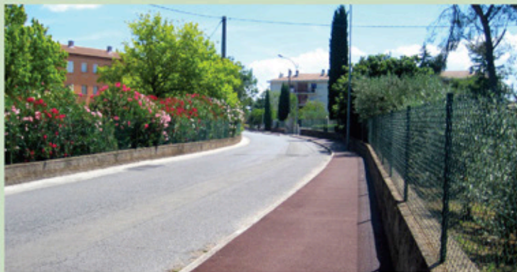
Réfection du trottoir de la voie Aurélienne