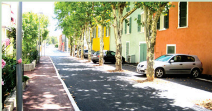
Réfection et aménagement de la rue Alphonse Daudet