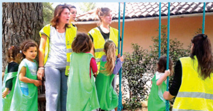
Sortie animation parc des automates (accrobranche)