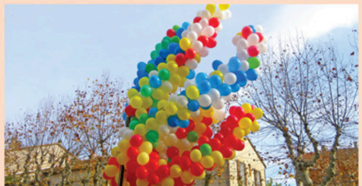
Téléthon : constitution d'un génome en ballon