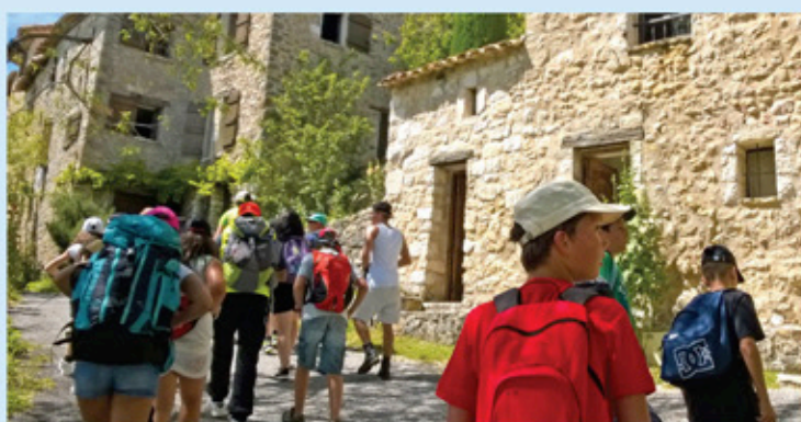
Journée rando sur le pic de St Victor