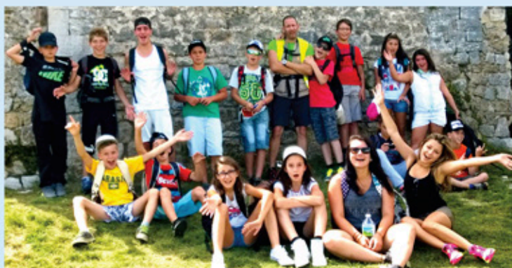
Séjour dans les gorges du Verdon

17 jeunes sont partis en séjour avec la Maison des Jeunes du Cannet des Maures du 21 au 25 juillet 2014.