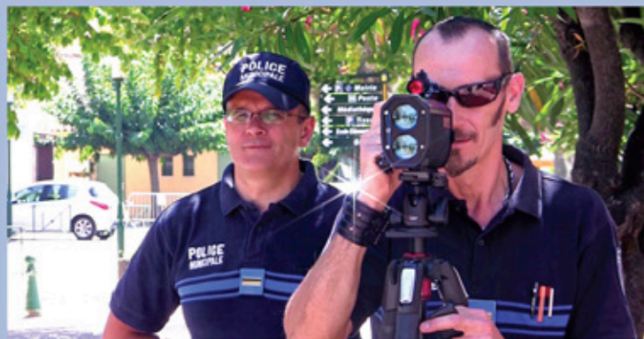
Contrôle de vitesse (avenue de Verdun)

Les relevés effectués par la Police Municipale depuis début juillet ont montré que les principaux excès de vitesse sont localisés sur plusieurs voies de la commune : chemin de Bourboutéou, chemin de Chante Coucou, chemin de Bouillidou, voie Aurélienne, avenue de Verdun, route du Vieux Cannet.