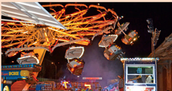
Les manèges retrouvent l'espace de la gare SNCF

Vendredi 25 juillet a été donné le coup d'envoi de la fête foraine 2014 avec cette année une installation des manèges et attractions en centre-ville et le long de la halle SNCF.