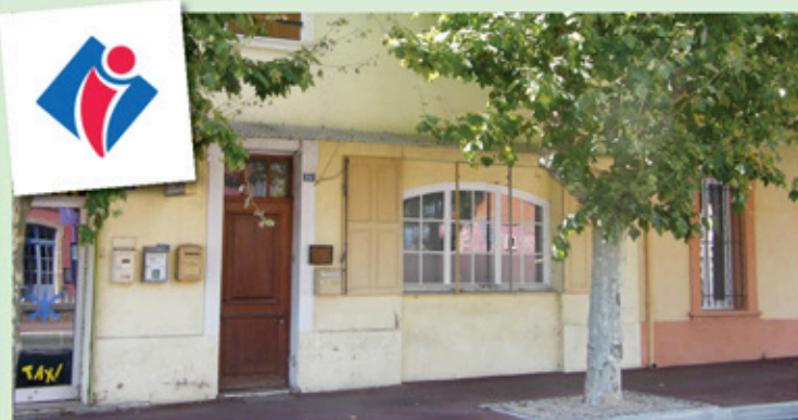
Futur emplacement du Point Information Tourisme

Lors du Meeting aérien de la Base EALAT les 28 et 29 juin , le Point Information Tourisme a présenté les nombreux domaines viticoles implantés sur la commune, ainsi que le programme des animations estivales. Les établissements Meilland s'étaient associés à la commune afin de fleurir le stand avec leurs nouvelles variétés.