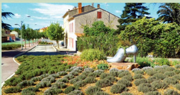
Mise en valeur de la chaussure fleurie