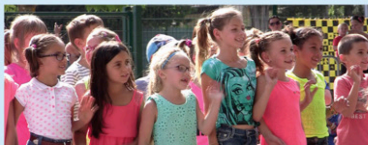
Kermesse école élémentaire