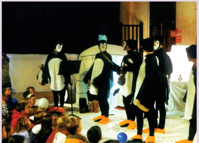
Les assistances maternelles déguisées pour le spectacle de Noël