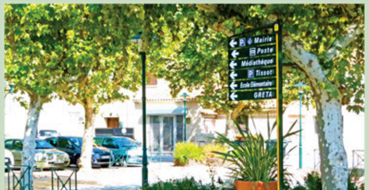
...pour mieux se repérer et bien circuler