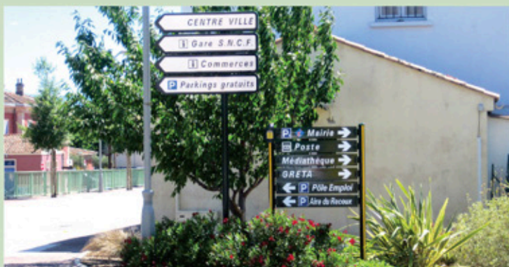
De nouveaux panneaux directionnels en centre-ville...

Une seconde action est programmée cet automne. Elle consistera à la pose en régie de deux ensembles de panneaux pour marquer et identifier les commerces de la zone CAP 7. Elle sera complétée par la pose de panneaux de direction sur la RdN7 pour orienter les automobilistes vers les parcs d'activités de la Gueiranne, du Théron et du Portaret.