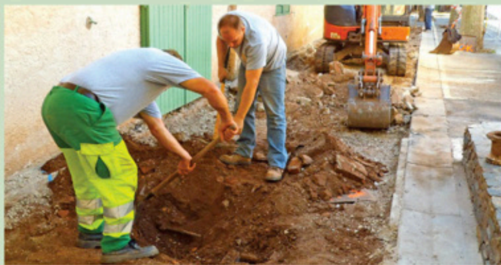
Rénovation des abords de la salle de danse