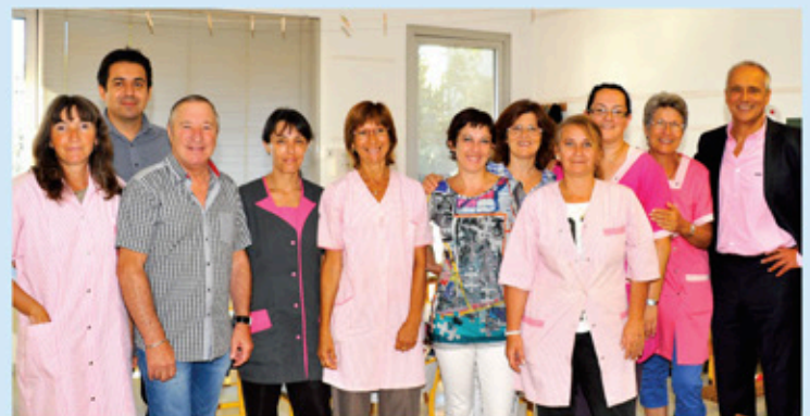
Les ATSEMS - Rentrée 2014 - 215

Elles ont un rôle important au sein de la vie de l'école . Elles sont en permanence au contact de vos enfants durant le temps scolaire, les récréations, la pause méridienne, la sieste. Cette année, elles vont s'impliquer dans la préparation de la nouvelle réforme des rythmes scolaires en proposant des petites activités aux demi-pensionnaires (jardinage, contes, relaxation,...).