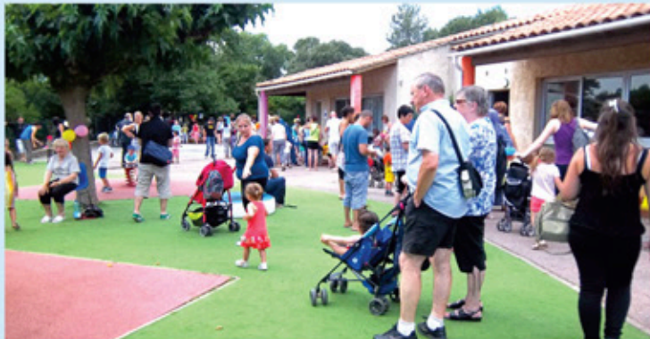
Kermesse École Maternelle