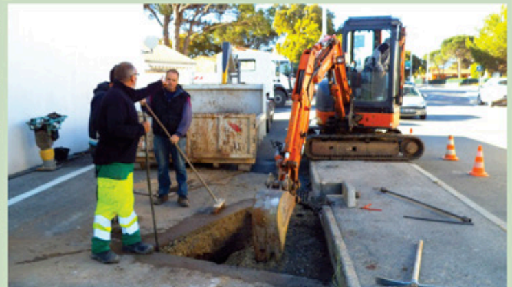
Réparation d'une fuite sur la Traverse Taurelle