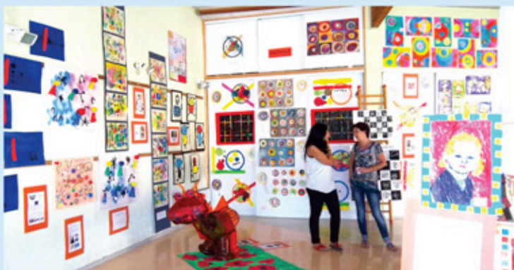
Exposition projet «Regards croisés»