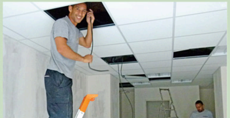
Travaux de rénovation

Les réceptions sont programmées entre septembre et octobre pour une ouverture des commerces cet automne.