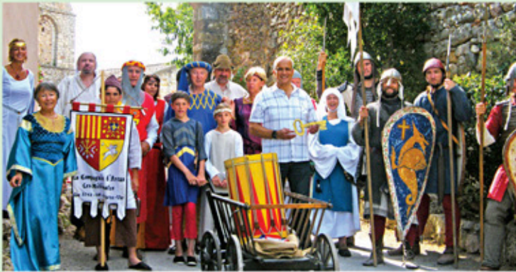
Ouverture de la Fête médiévale