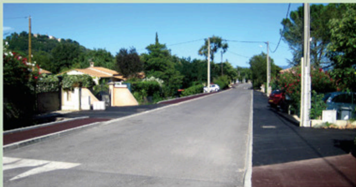
Réfection et aménagement du chemin du Bouillidou

• Rue Alphonse Daudet (réfection de la chaussée et du trottoir) • Voie Aurélienne (réfection du trottoir) • Avenue du 8 mai 1945 (modification du trottoir) • Traverse Bachas (amélioration et reprise du déversoir en régie, partiellement détruit suite aux inondations du 19 janvier 2014, réfection du trottoir et de la voirie partiellement endommagés) • Rue Frédéric Mistral (réfection du trottoir) • Chemin du Bouillidou (création d'un réseau pluvial et des trottoirs par les agents communaux, enfouissement du réseau téléphonique ; réfection de la chaussée en enrobé avec pose de trois ralentisseurs, création de places de stationnement en bordure de chaussée et application de béton bitumineux sur les trottoirs créés en régie).