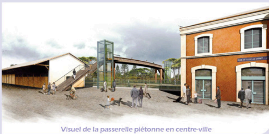
Visuel de la passerelle piétonne en centre-ville

Après plusieurs scénarios, la commune a retenu un modèle de passerelle courte. Le matériau retenu, le BFUP, pour Béton Fibré Ultra Performant, a été sélectionné pour sa résistance, son faible entretien et ses qualités esthétiques (c'est le matériau qui compose la célèbre passerelle du MUCEM à Marseille).