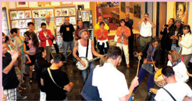
Vernissage de l'exposition «La différence»