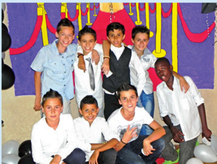
Les garçons, chic et choc

Cette année encore, afin de faciliter les démarches administratives des familles, nous avons mis en place un dossier unique d'inscription regroupant toutes les activités municipales scolaires et extra scolaires : cantine, transport, étude, périscolaire, accueil de loisirs et la garderie, proposée à tous gratuitement de 16h00 à 16h30 tous les jours et de 11h30 à 12h00 le mercredi.