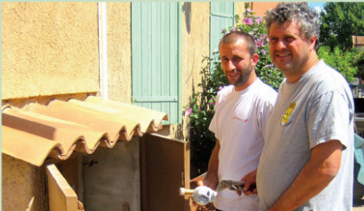
Changement d'un compteur - agents du pôle public de l'eau

Le Pôle Public de l'Eau de la commune poursuit sa campagne de renouvellement et de modernisation de son parc de compteurs d'eau potable afin de maintenir la qualité de ce service public.