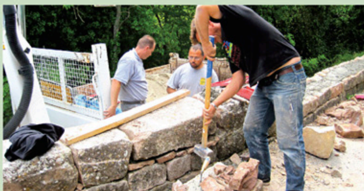
Reconstruction du mur de soutènement en pierre

• La reconstruction de l'aménagement du vallon des Moulières, partiellement détruit lors des dernières inondations du 19 janvier 2014 au niveau du lavoir des Moulières. Les travaux ont consisté à la reprise de l'enrochement et à l'amélioration de la surverse nécessaire à l'évacuation des eaux de la route du Vieux Cannet en cas de débordement du ruisseau.