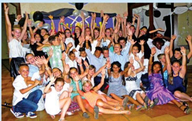
Les jeunes du CM2

Cette année, tous les élèves CM2 de l'école élémentaire Denis Tissot, soit une quarantaine d'enfants, se sont retrouvés pour cette soirée 2014 à la salle du Recoux pour la deuxième édition du «Bal de fin d'année».