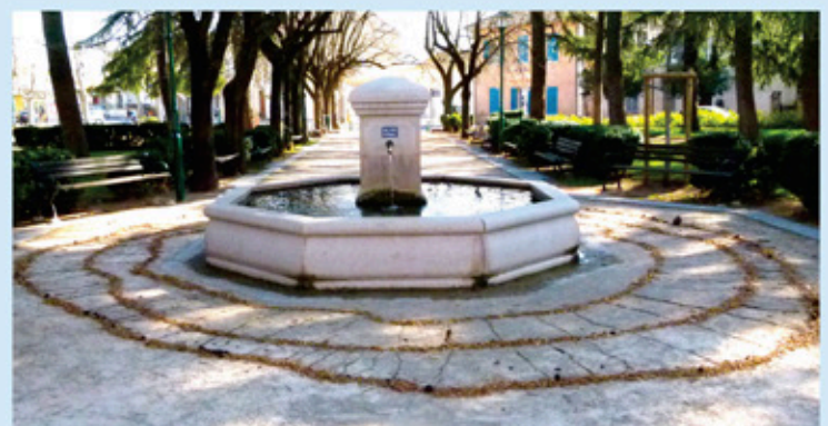
Projet «Land Art»