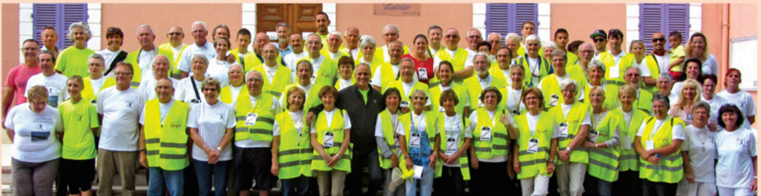
Le Groupe des signaleurs «Cannétoise 2014»

Une ambiance bon enfant et conviviale dans une organisation maîtrisée.