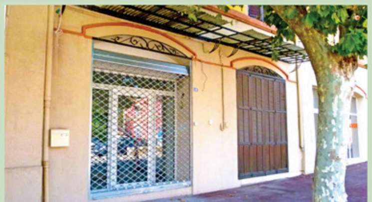
Bientôt de nouveaux commerces en centre ville