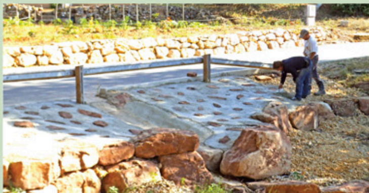
Reconstruction de l'aménagement du vallon des Moulières

Outre les missions d'entretien du patrimoine communal, les agents techniques des équipes voirie et bâtiment ont réalisé les travaux suivants :