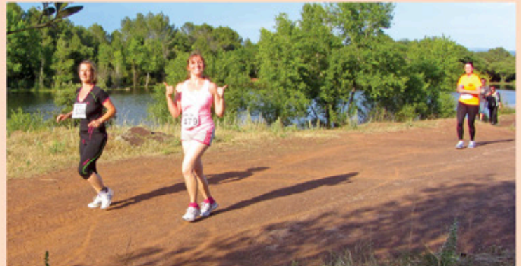
Passage en pleine nature, au bord du lac Canetti

Cette course nature de 12,5 km dans la réserve naturelle nationale du Cannet des Maures, accompagnée d'un 6 km découverte et d'épreuves pour les enfants, s'inscrit dans la tradition des courses populaires. L'équipe organisatrice est constituée du pôle sports et associations et du pôle technique de la mairie, aidés par de nombreuses associations locales qui ont fourni 85 signaleurs. Tous se sont mobilisés pour l'accueil des coureurs. À 18 h30, 272 concurrents ont découvert avec plaisir des paysages diversifiés des pistes du lac Canetti aux routes champêtres du Vieux Cannet. Un profil rapide en pleine nature, qui a séduit autant les confirmés venus faire une bonne séance que les débutants, entre routes et chemins de terre.