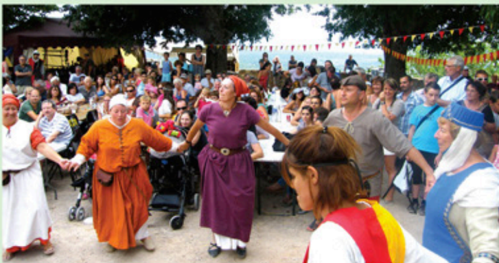
Les danseurs des Médiévales des Arcs

Retrouvez d'autres photos sur le site de la commune : www.lecannetdesmaures.com