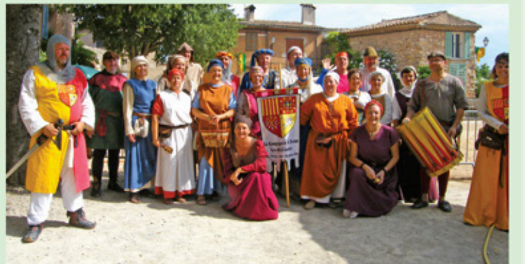
La troupe des Médiévales des Arcs