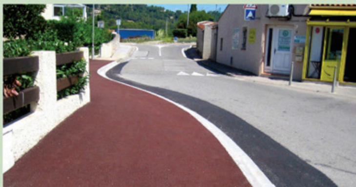
Modification du trottoir de l'avenue du 8 mai 1945