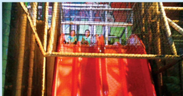
Sortie animation parc des automates (toboggans)