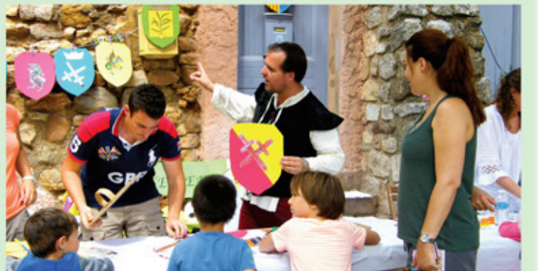
Atelier des enfants, E. Joly, les blasons