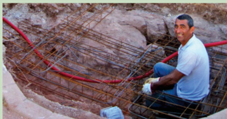
Travaux d'installation de la sculpture Jean-Pierre RIVES