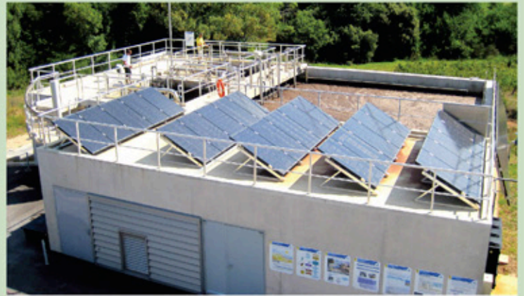
Station d'épuration avec ses panneaux solaires

Ces boues déshydratées ont été évacuées vers la plateforme de compostage de Manosque pour être valorisées.