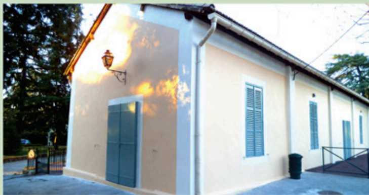
Rénovation des façades Nord et Est de la salle de danse

• La rénovation des abords de la salle de danse. Les travaux ont consisté à la réfection des raccordements des réseaux d'eau et d'assainissement, ainsi qu'à la rénovation de la façade Nord et la façade Est.