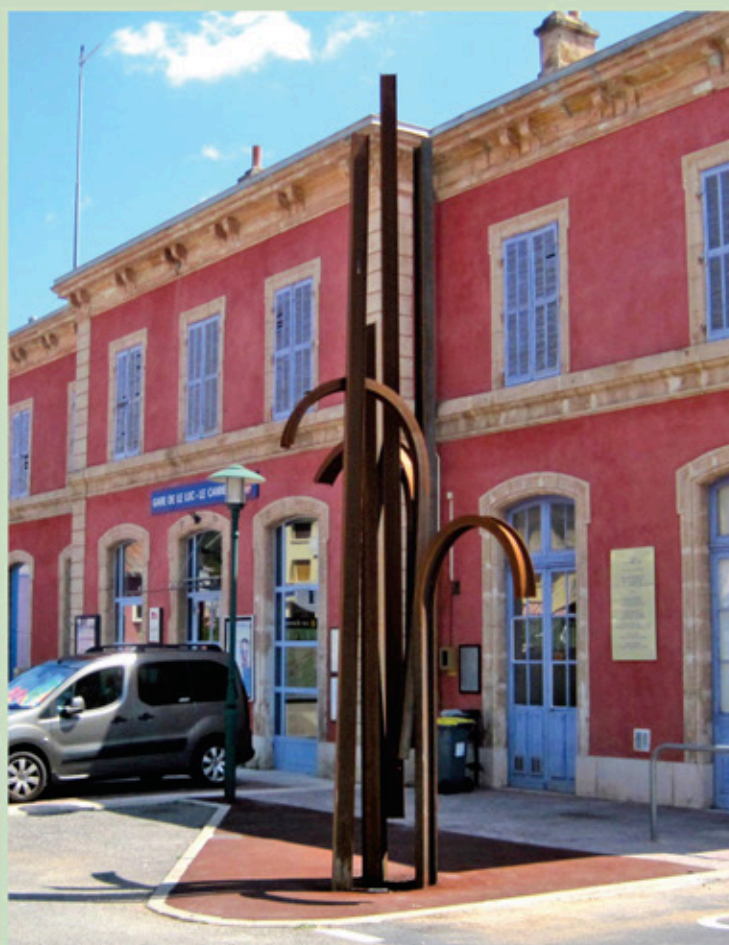
Sculpture Jean-Pierre RIVES