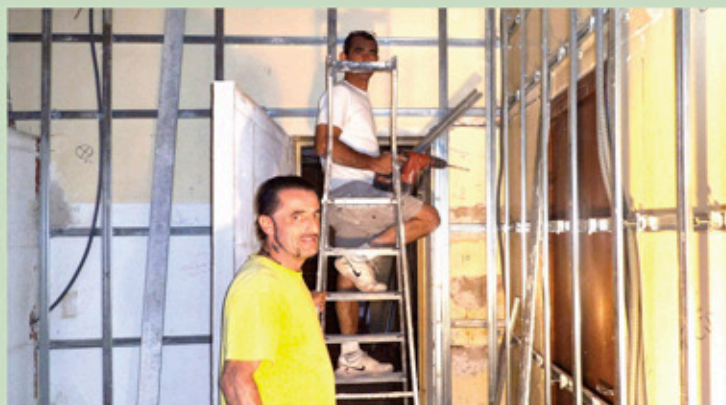
Travaux de rénovation effectués en régie avec les agents