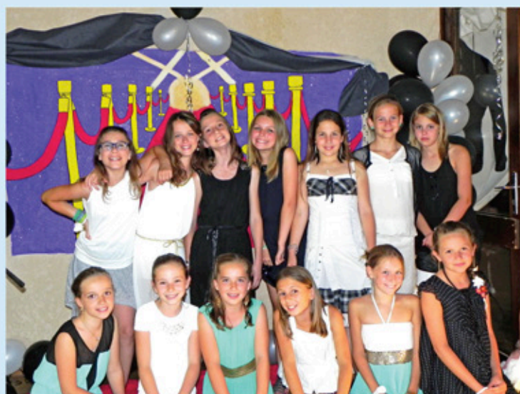
Les filles, grâce et finesse