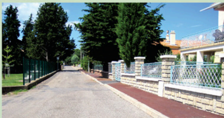
Réfection du trottoir de l'avenue Frédéric Mistral