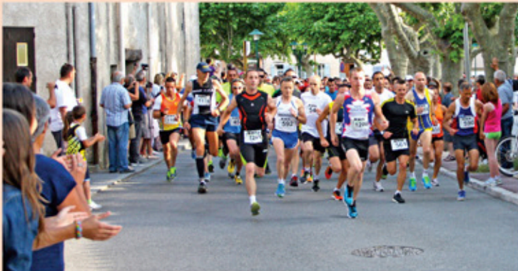
Départ de la «Cannétoise 2014»