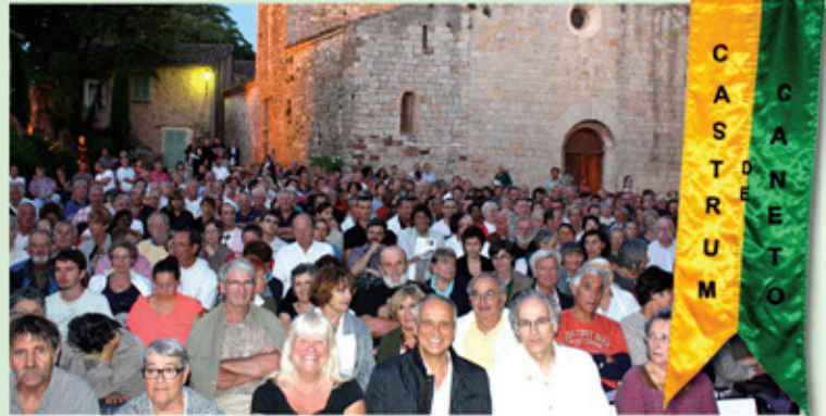
Concert Carmina Burana médiéval