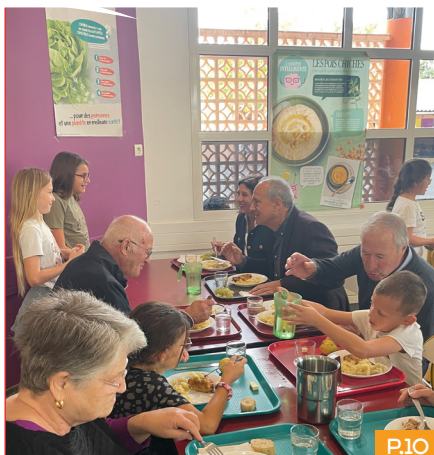
LA VILLE CONTINUE DE DÉVELOPPER DES ACTIVITÉS QUI SONT 100% DÉDIÉES À SES AÎNÉS.