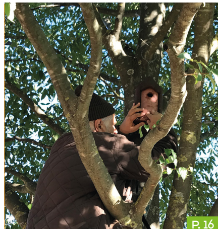
LA VILLE DU CANNET DES MAURES MISE SUR LES ACTIVITÉS DE SENSIBILISATION.