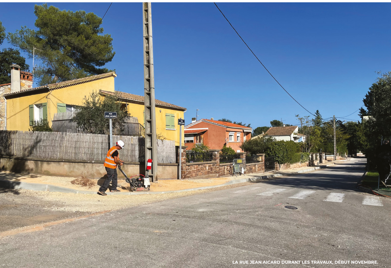
LA RUE JEAN AICARD DURANT LES TRAVAUX, DÉBUT NOVEMBRE.