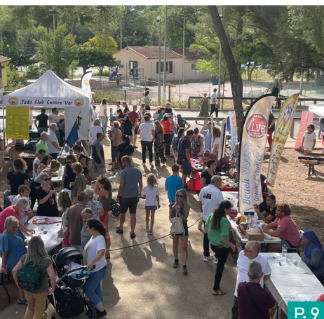
LES MANIFESTATIONS DE L'AUTOMNE ONT RENCONTRÉ UN FRANC SUCCÈS EN 2024.