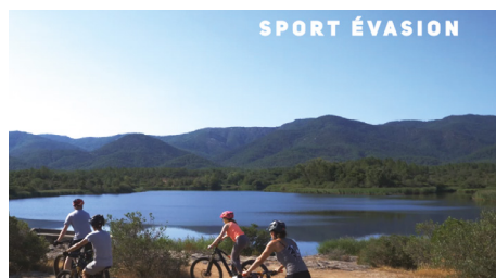
EXTRAIT DU FILM "LE CANNET EN MAJESTÉ".

Le film "Le Cannet en Majesté" a été spécialement projeté lors de la journée d'accueil des nouveaux arrivants et offert à chaque nouveau foyer sur clé USB.