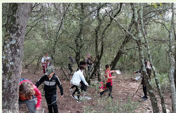
AU COEUR DE LA FORÊT PÉDAGOGIQUE.