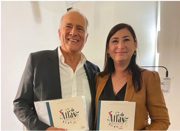
M. LE MAIRE ET MME AGERO, DE L'OFFICE FRANÇAIS DE LA BIODIVERSITÉ.

V endredi 13 septembre dernier a eu lieu la cérémonie de remise de l'Atlas de la Biodiversité Communale (ABC). Ce document crucial, résultat d'une collaboration étroite avec des experts et associations spécialisées, marque une avancée majeure dans la protection et la valorisation de la biodiversité exceptionnelle de notre territoire. Les jeunes Cannetois, premier public concerné par cet Atlas, y trouveront une mine d'informations.