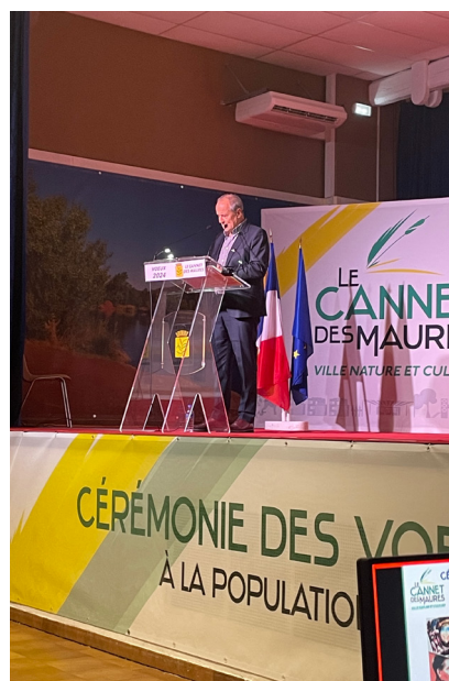
M. LE MAIRE LORS DE LA CÉRÉMONIE DES VOEUX 2024.