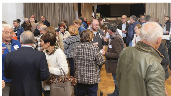
LA MATINÉE S'EST TERMINÉE PAR UN APÉRITIF.