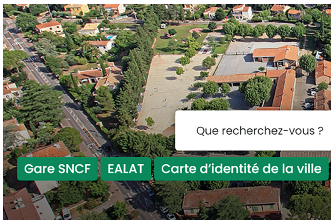
LA PAGE D'ACCUEIL DU NOUVEAU SITE DE LA VILLE.