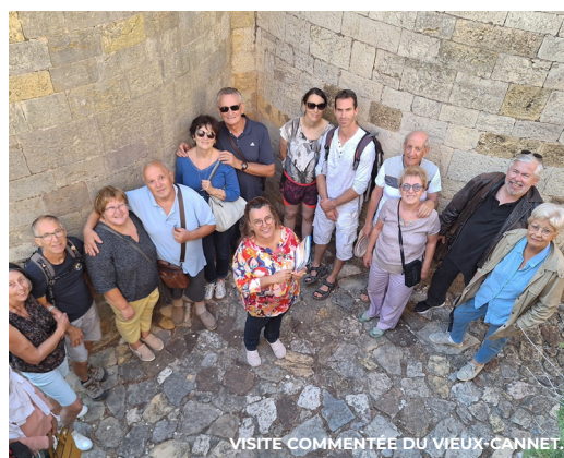
VISITE COMMENTÉE DU VIEUX-CANNET.

L e 7 septembre, de la culture au sport, en passant par la solidarité, plus de 60 associations ont accueilli les curieux afin de partager leurs projets pour cette nouvelle année. Ce rendez-vous a également été l'occasion pour les Cannois de découvrir les nouveaux clubs qui enrichissent la vie locale et d'échanger avec des professionnels du bien-être (salles de sport privées, services de soins, massages...). Cette journée a permis à chacun de trouver une association à rejoindre ou de s'engager en tant que bénévole, tout en renforçant le lien social et le dynamisme local.