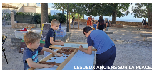
LES JEUX ANCIENS SUR LA PLACE.