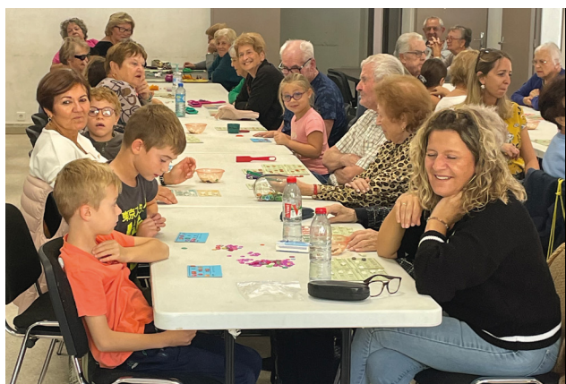
LE LOTO INTERGÉNÉRATIONNEL A FAIT SALLE COMBLE AU GRAND FOYER.

D u 30 septembre au 4 octobre, Le Cannet des Maures a célébré la Semaine Bleue, un moment fort pour les échanges intergénérationnels.