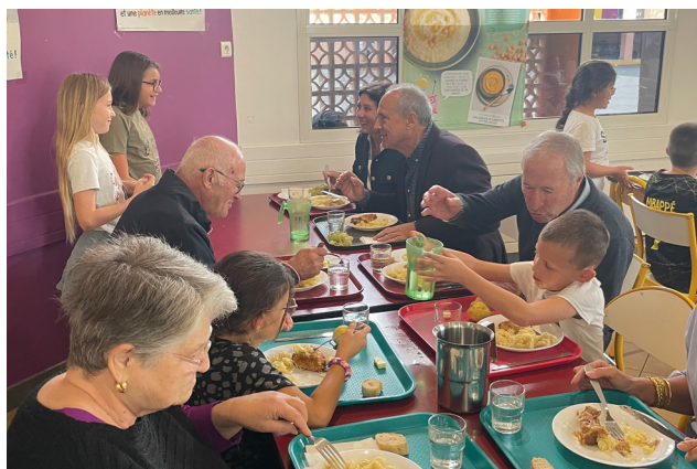
M. LE MAIRE A PARTICIPÉ AU PREMIER DÉJEUNER AU RESTAURANT SCOLAIRE.