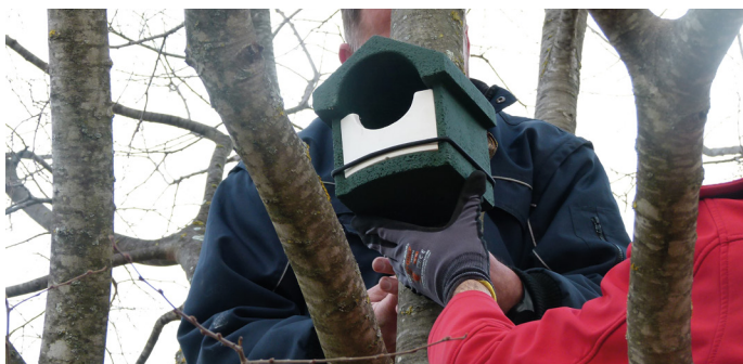
POSE D'UN NICHOUR DURANT L'HIVER DERNIER.

Afin de préserver la faune locale, une trentaine de nichours supplémentaires va être installée pendant l'automne. La Boudrague, les micro-espaces verts de l'impasse Bachas et de la rue de l'Argelas ainsi que le Vieux-Cannet, ont ainsi été choisis pour les accueillir.