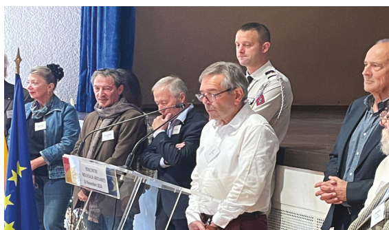
L'ACCUEIL DES VILLES FRANÇAISES ÉTAIT REPRÉSENTÉ.

Pour rappel, la ville du Cannet des Maures a atteint le chiffre de 5 132 habitants l'an dernier, soit une augmentation de plus de 17 % par rapport au dernier recensement de référence. Cet accroissement démographique, fruit d'un recensement précis et de l'implication de tous, confirme l'attractivité et le dynamisme de la commune.