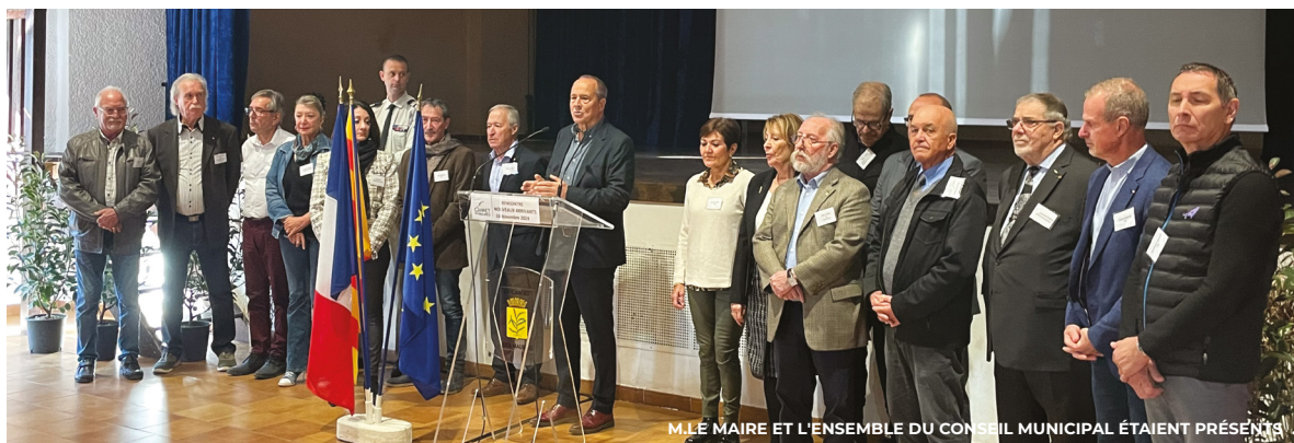
M. LE MAIRE ET L'ENSEMBLE DU CONSEIL MUNICIPAL ÉTAIENT PRÉSENTS.

Cette année, plus de 130 nouveaux foyers ont déjà fait le choix de s'installer au Cannet des Maures.