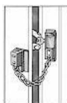
entrebâilleur de porte